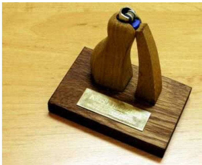
Křesadlo 2001 - 2002

Za rok 2002 to bylo celkem 31 křesadel, které kromě Prahy předávali naši partneři v šesti městech – Česká Lípa, České Budějovice, Pelhřimov, Olomouc, Ústí nad Labem a Zlín.